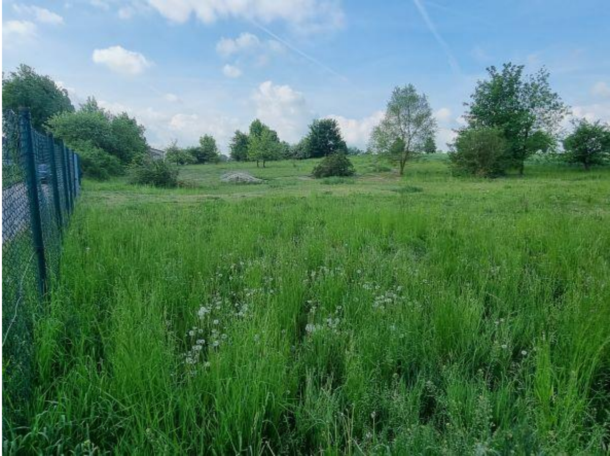
Blick über das Plangebiet von Nord nach Süd, 20.05.22