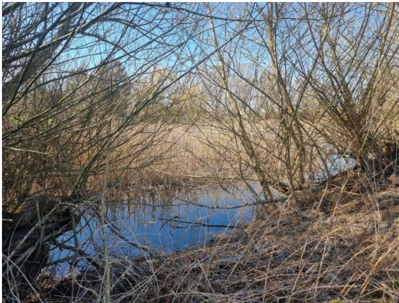
Abb. 3: Blick auf das nordwestlich des Plangebietes gelegene Kleingewässer

Unweit des Plangebietes befinden sich zwei Gewässer. Während östlich der Haussee liegt, grenzt nordwestlich ein Kleingewässer mit ausgedehntem Röhrichtbewuchs an. Im Plangebiet waren Amphibien deshalb vorrangig während der Frühjahrswanderung zu erwarten, da am Rand des Grundstücks zumindest partiell geeignete Winterquartierstrukturen lagen. Das untersuchte Grundstück kann jedoch auch als Sommerlebensraum für Amphibien eine Rolle spielen. Allerdings präsentierte sich die Fläche zu Beginn der Untersuchung sehr kurzrasig. Es fand sich Kot von Schafen, die die Fläche offensichtlich im Vorjahr intensiv beweidet hatten. Bedingt durch die anhaltende Trockenheit im Untersuchungs-jahr 2022 wuchs auch im Verlauf der Untersuchungen keine besonders dichte Vegetationsdecke heran. Somit hielten sich geeignete Strukturen, die Amphibien und Reptilien Deckung geboten hätten, in Grenzen.