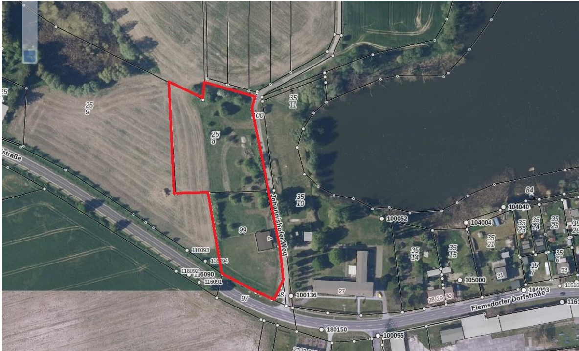
Abb. 1: Lage des Untersuchungsgebietes (rot umrandet)

In einem Plangebiet am nordwestlichen Ortsrand von Flemisdorf (Uckermark) wurden 2022 faunistische Kartierungen in Auftrag gegeben. In der Abb. 1 ist die Lage des Plangebietes dargestellt. Untersucht wurden die Artengruppen Brutvögel, Amphibien und Reptilien innerhalb des Plangebietes und in den unmittelbar angrenzenden Bereichen.