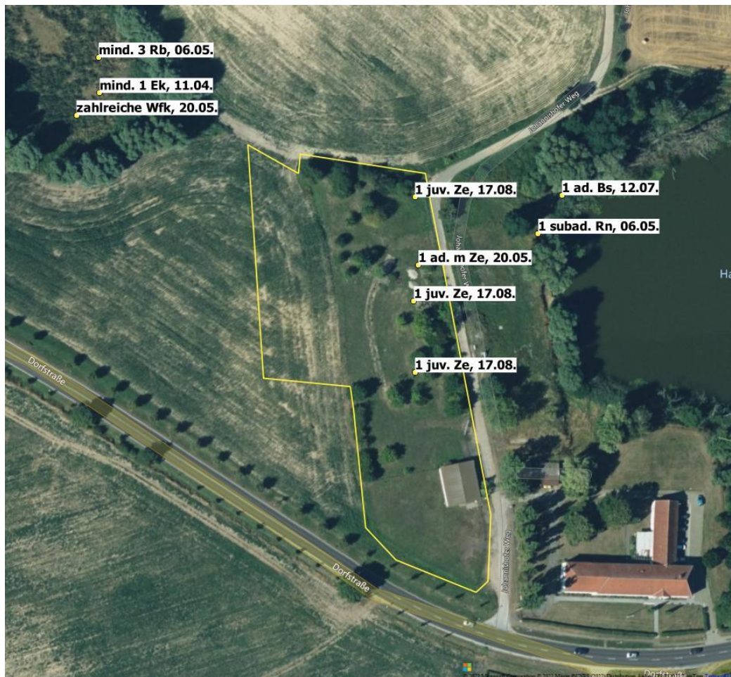
Abb. 4: Übersicht über die Fundpunkte der Amphibien und Reptilien (erstellt mit QGIS, Version 3.4.5-Madeira, GNU GENERAL PUBLIC LICENSE, http://www.gnu.org/licenses ; Quelle Karte: Bing Maps)

In der Abbildung 4 sind alle Fundpunkte kartographisch dargestellt. Dabei kommen folgende Abkürzungen zur Anwendung: Bs=Blindschleiche, Ek=Erdkröte, Rn=Ringelnatter, Rb=Rotbauchunke, Wfk=Wasserfroschkomplex, Ze=Zauneidechse, juv=juvenil, sad=subadult, ad=adult, m=männlich, w=weiblich.