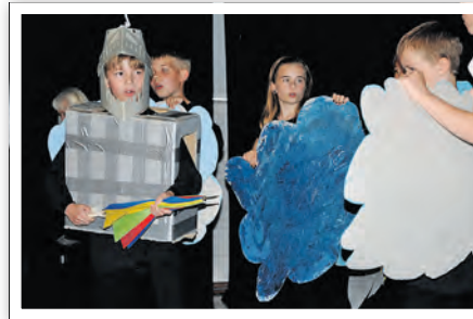
Linus 2016 als Ritter Rost

Das Auswahlverfahren an der Universität der Künste Berlin war umfangreich.