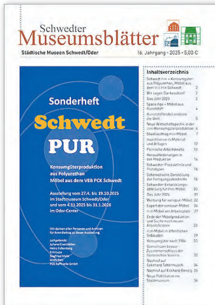
Cover des neuen Museumsblattes „Schwedt PUR“

Am Ende der Broschüre findet sich die Beschreibung der Publikation „Sportbuch Schwedt“ des Stadtmuseums. Das 360 Seiten starke Buch gewährt Einblicke in die Sportgeschichte von Schwedt. Viele Schwedterinnen und Schwedter haben dem Museum für die Sonderausstellung Bilder und Material zur Verfügung gestellt. Ein Teil davon wird in „Sportstadt Schwedt“ veröffentlicht. Außerdem werden die in den letzten Jahrzehnten international erfolgreichen Sportlerinnen und Sportler aus Schwedt, wie Britta Steffen, Sebastian Brendel, Jon Luke Mau, Jörg Hoffmann, Melvin Imoudou und Toralf Berg in gesonderten Porträts vorgestellt. Das Buch ist für 20 Euro im Stadtmuseum erhältlich.