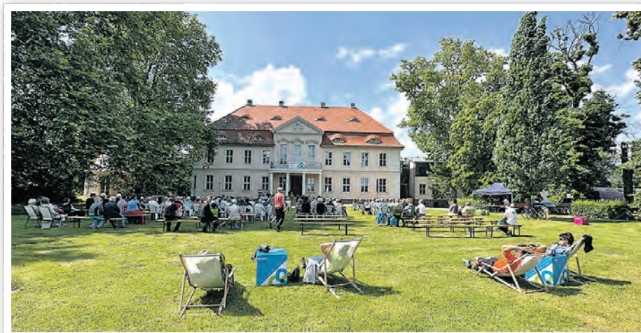
Zurücklehnen und genießen: Klassik pur vor der einmaligen Schloss-Kulisse im Lenné-Park.

Konzertort mit Seltenheitswert: Die Wiese vor dem Schloss verwandelt sich für einen Nachmittag in einen natürlichen Konzertsaal. Besucherinnen und Besucher können es sich auf der Wiese gemütlich machen und die Musik inmitten der Parklandschaft genießen. Dass dieser besondere Ort genutzt werden darf, ist keine Selbstverständlichkeit – der Förderverein hat sich erneut intensiv für die Genehmigung eingesetzt, um diese Tradition fortzuführen.