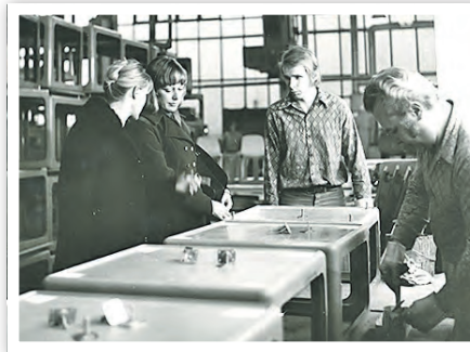
Besichtigung der PUR-Möbelproduktion im VEB PCK Schwedt, 1975

Andere Beiträge der Broschüre zeigen die politische und wirtschaftliche Einbindung auf, stellen die Entwicklungsabteilung vor, den weitreichenden Export, die Investitionen in Maschinen und Anlagen, die Fertigungsabschnitte und zeigen die Herausforderungen in der Produktion auf. Ausführlich vorgestellt werden zudem die Schwedter