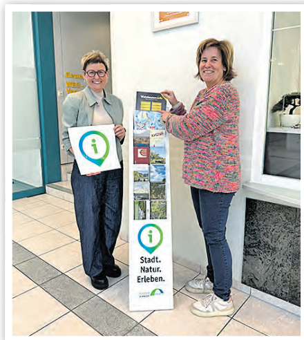
Infopunkt bei den Wohnbauten

Dazu zählt die Einrichtung touristischer Infopunkte an ausgewählten