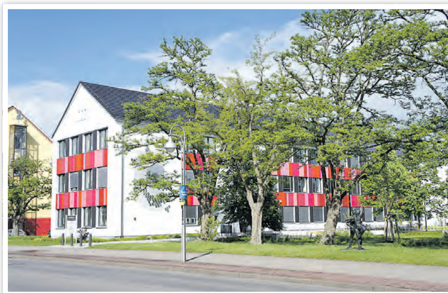
Die Volkshochschule befindet sich im Haus der Bildung und Technologie.

Ein Blick in das Programm lohnt sich. Auf der Website der Volkshochschule www.vhs-schwedt.de sind ab dem 2. Juni alle Angebote freigeschaltet und