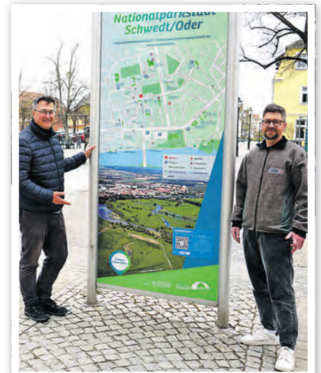
Infotafel am Vierradener Platz

Darüber hinaus wurden auch die beiden großen Infotafeln in der Vierradener Straße überarbeitet. Die Anlagen wurden ursprünglich als Begrüßungs- und Werbetafeln in der Innenstadt genutzt. Nach über 15 Jahren waren sie jedoch stark verwittert, durch Vandalismus beschädigt, unaktuell und einfach überholungsbedürftig. Im Zuge der Neugestaltung erhielten die Tafeln eine neue, zeitgemäße Ausrichtung und sind so zu optischen Blickfängern geworden, die sowohl Orientierung als auch touris-