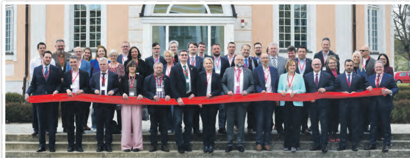
Beim feierlichen Auftakt waren über 50 deutsche und polnische Teilnehmende dabei.