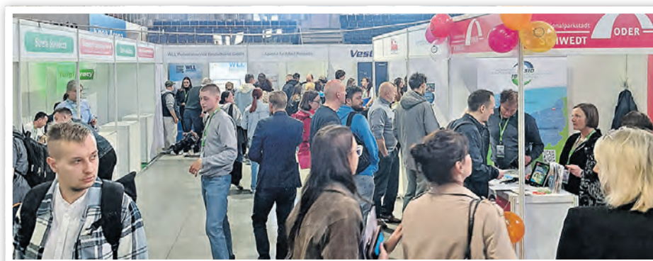
Messe Targi Pracy in Stettin

Die Teilnahme an der Messe unterstreicht die Bedeutung der grenzüberschreitenden Zusammenarbeit und der internationalen Fachkräftegewinnung für die wirtschaftliche Entwicklung der Region.