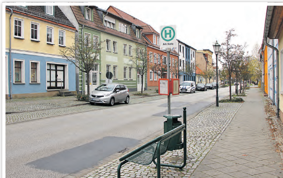
Berliner Straße zwischen Julian-Marchlewski-Ring und Vierradener Straße

Die Fahrbahndecke weist altersbedingte Rissbildungen und Ausmergelungen auf, die das Eindringen von Niederschlagswasser in die unteren Tragschichten begünstigen. Durch den Frost-Tau-Wechsel kommt es langfristig zu Substanzschäden. Daher ist eine Sanierung der Asphaltdeckschicht notwendig. Im Rahmen dieser Maßnahme soll die vorhandene Asphaltdeckschicht (mit partiellem Austausch der Binderschicht) bis zu 4 Zentimeter abgefräst und durch eine neue Asphaltdeckschicht in einer Stärke von 4 Zentimetern ersetzt werden. Die Fahrbahnbreite bleibt erhalten. Das vorhandene Fahrbahngefälle wird für die neue Asphaltdeckschicht übernommen. Darüber hinaus ist die Reinigung und Neuverfugung von ca. 850 Quadratmetern Mosaikpflaster, ca. 1835 Quadratmetern Kleinpflaster und der 1200 Meter langen zweireihigen Gosse sowie die Markierung des Fußgängerüberwegs vorgesehen.